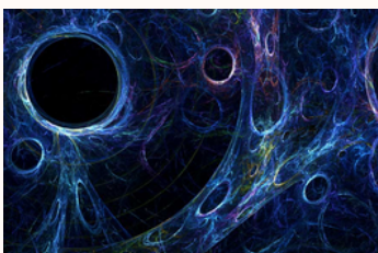
(exemple d'image de matière noire)

Le livre donne des informations sur toutes les cartes du jeu : leur puissance, leurs capacités ainsi que des anecdotes les concernant. Par exemple la carte "matière noire" est la plus prisée des joueurs car elle permet de sauver une carte perdue au tour précédent contre la carte rubis.